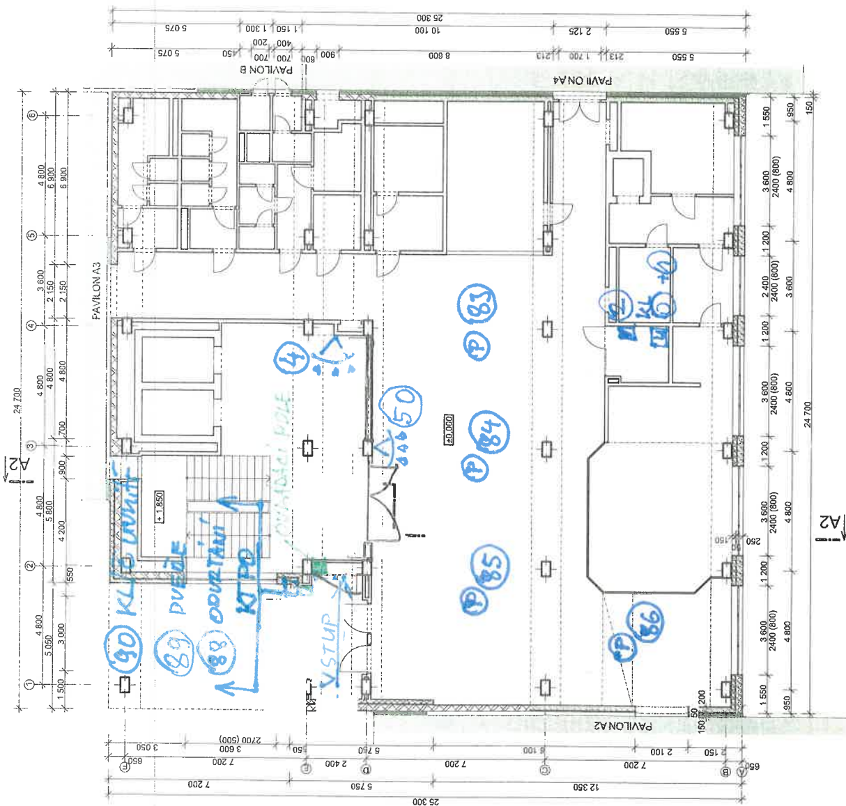
LEGENDA STÁVAJÍCÍCH OBVODOVÝCH STĚN